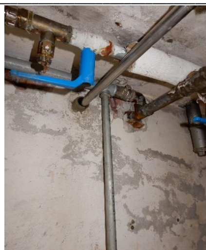
Tæring på kælderinstallation