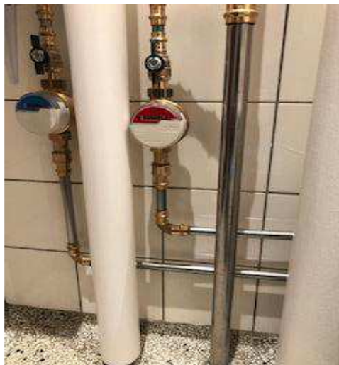
Eksempel på målerinstallation på WC