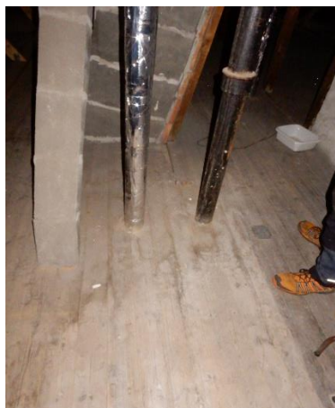
FS udluftning i loftrum