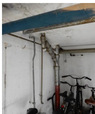
Faldstamme i kælder