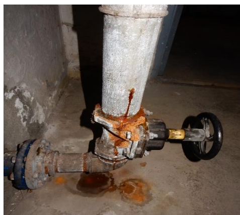
Tæring på rør i varmecentral

Det nye brugsvandssystem udføres i rustfri stålør som "inliner system", hvor cirkulationen er placeret inden i varmtvandsstigrøret i lejlighederne. Hermed undgås det at have brugsvand i loftrummet overhovedet.