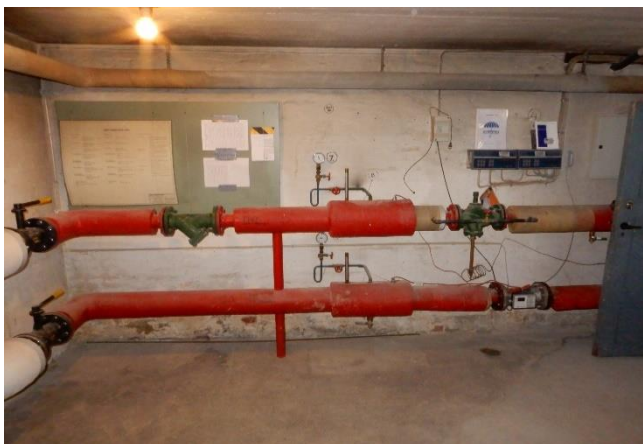
Fjernvarmeinstallation og automatik

I forslaget er således medtaget en komplet renovering af installationerne i varmecentralen inklusive ny automatik og indregulering.