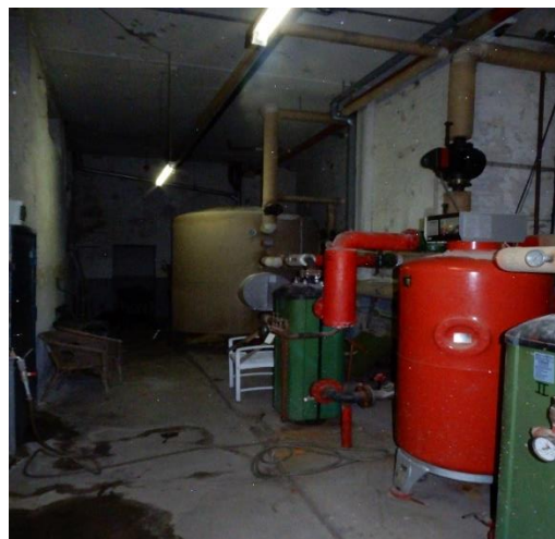
Varmtvandsbeholder og trykexpansion