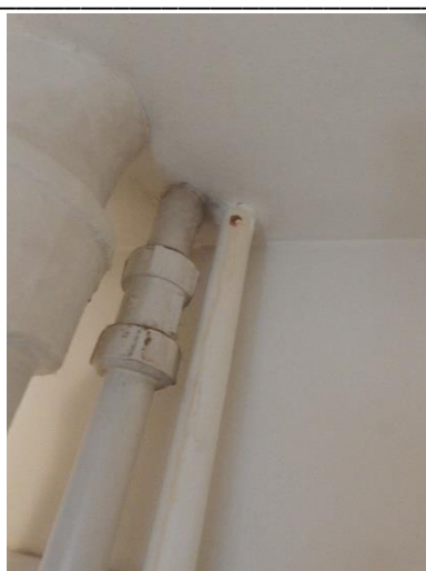
Tæring på vandrør