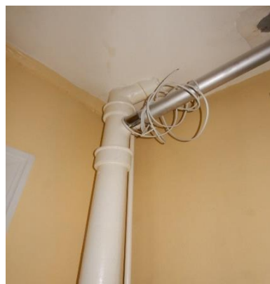
WC faldstamme i lejlighed