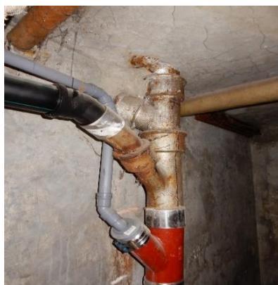
Faldstamme i kælder