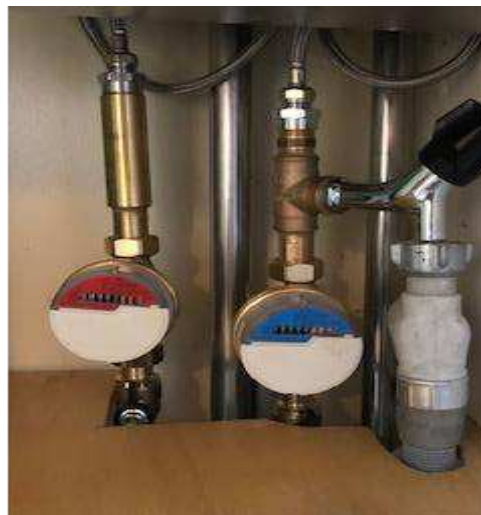
Eksempel på målerinstallation i køkken