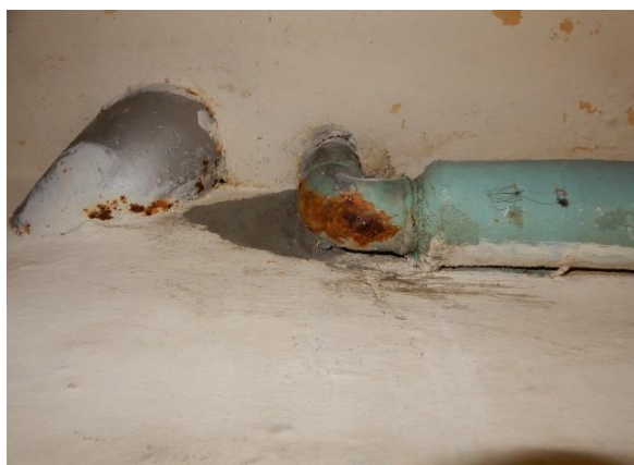
Tæring på rør i kælder